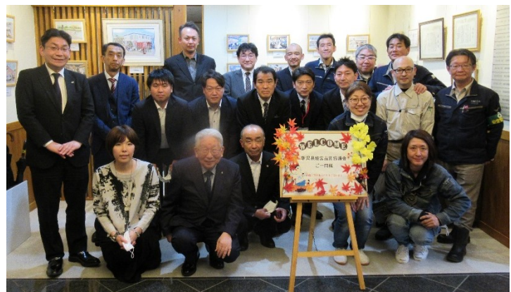
みんなで記念写真 (^^♪

素敵なお土産もいただきました♪ 日鉄工材(株)の皆様このたびはありがとうございました☆感謝☆